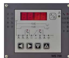
RIADIACA JEDNOTKA WS 708