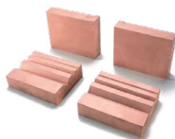
SADA ELEKTRÓD PRE SQ/AS 121