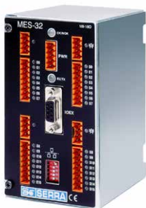
MES-32 ROZŠIROVACÍ MODUL