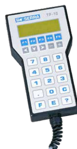
PRENOSNÝ PROGRAMOVACÍ TERMINÁL TP-10