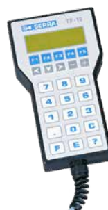
PRENOSNÝ PROGRAMOVACÍ TERMINÁL TP-10